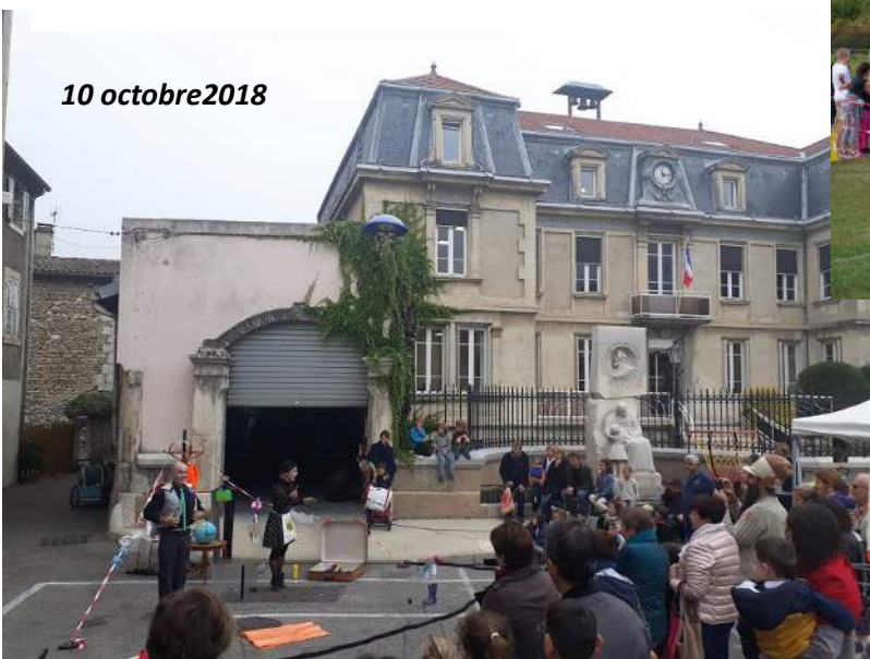
10 octobre 2018

Dans le cadre de la Semaine Bleue, deux spectacles ont été organisés pendant le marché du mercredi matin