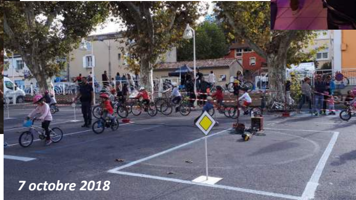
7 octobre 2018

Dès le plus jeune âge, on s'initie au code de la route sur son vélo, grâce aux conseils de la Police Municipale lors de la fête du vélo