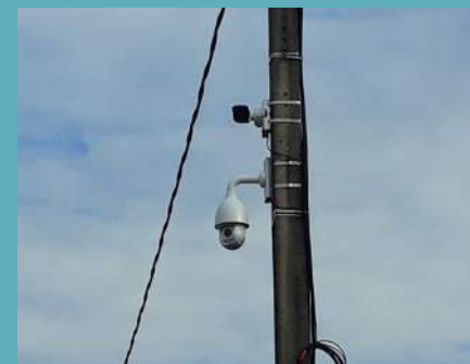
Certaines caméras sont équipées de lecteurs de plaques d'immatriculation