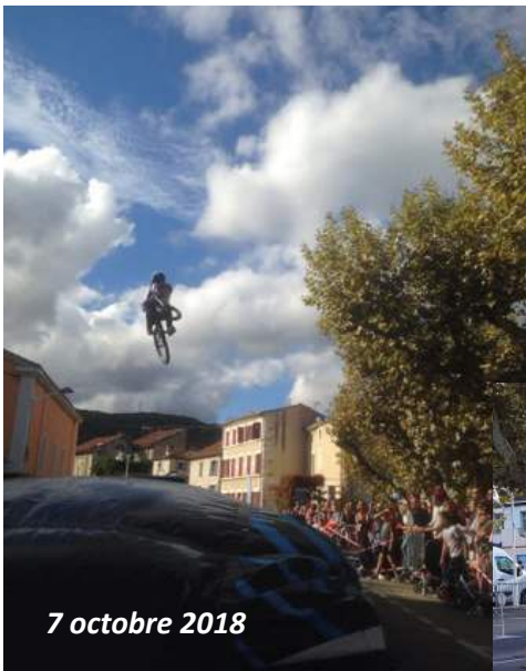
7 octobre 2018

Atterrissage en douceur dans un matelas après des sauts très spectaculaires