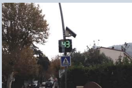
Le radar fonctionne à l'énergie solaire

Si les polices nationales et municipales procèdent à des contrôles réguliers, les élus ont souhaité étoffer le dispositif, en privilégiant la sensibilisation et la pédagogie. Un radar pédagogique mobile a donc été acquis par la commune. Il sera installé dans les différents quartiers et affichera la vitesse constatée.