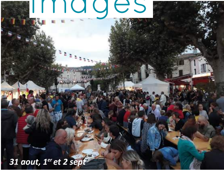
31 août, 1 er et 2 sept