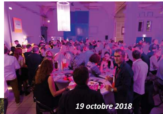
19 octobre 2018

Beau succès pour la 3 ème soirée «Bistronomie» au Cep avec 3 chefs étoilés et les Vignerons locaux, pour le plaisir des papilles