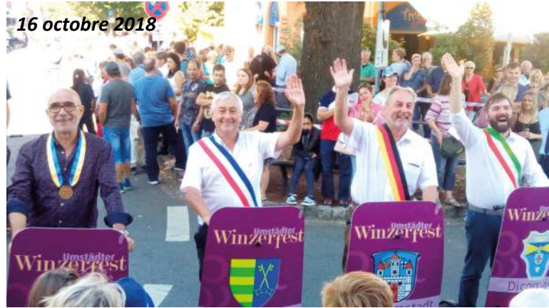
16 octobre 2018