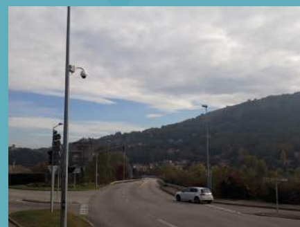
Les carrefours stratégiques sont couverts

Les images seront conservées trois semaines. Passé ce délai, les données sont automatiquement effacées. Seule une personne habilitée a le droit de visionner les enregistrements.